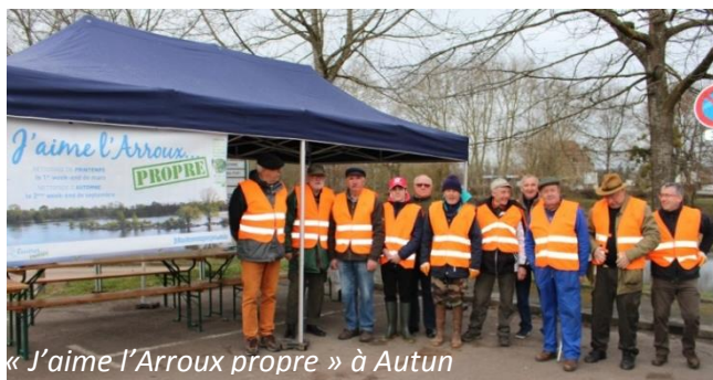
« J'aime l'Arroux propre » à Autun

de collecte de déchets sur les 4 cours d'eau. Malgré une météo incertaine avec des pluies annoncées dans la matinée, ce sont 302 bénévoles qui étaient au rendez-vous le samedi 2 mars 2019. Ils ont arpenté les bords du fleuve et des rivières pour ramasser 54,5 m 3 de déchets.