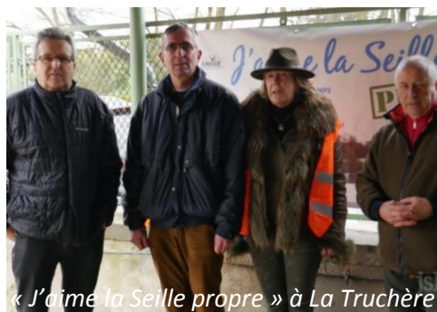
« J'aime la Seille propre » à La Truchère