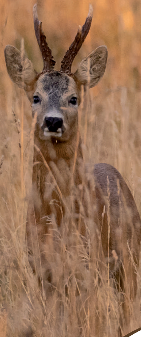
SCHÉMA DÉPARTEMENTAL DE GESTION CYNÉGÉTIQUE DE SAÔNE-ET-LOIRE 2025/2031

Approuvé par arrêté préfectoral le 15 juillet 2025